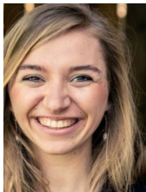
Actrice Elena Peeters