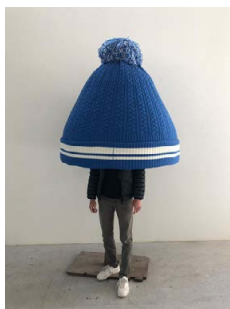
Erwin Wurm, Beanie (beannies), 2019, polyester en wol © Erwin Wurm

Na het museumbezoek is er nog een korte doe-opdracht voor in de klas en een gave videoclip om het project op een leuke manier af te sluiten.