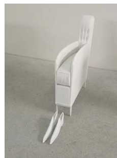
Erwin Wurm, Vatis fauteuil, 2021, polyester en aluminium © Erwin Wurm