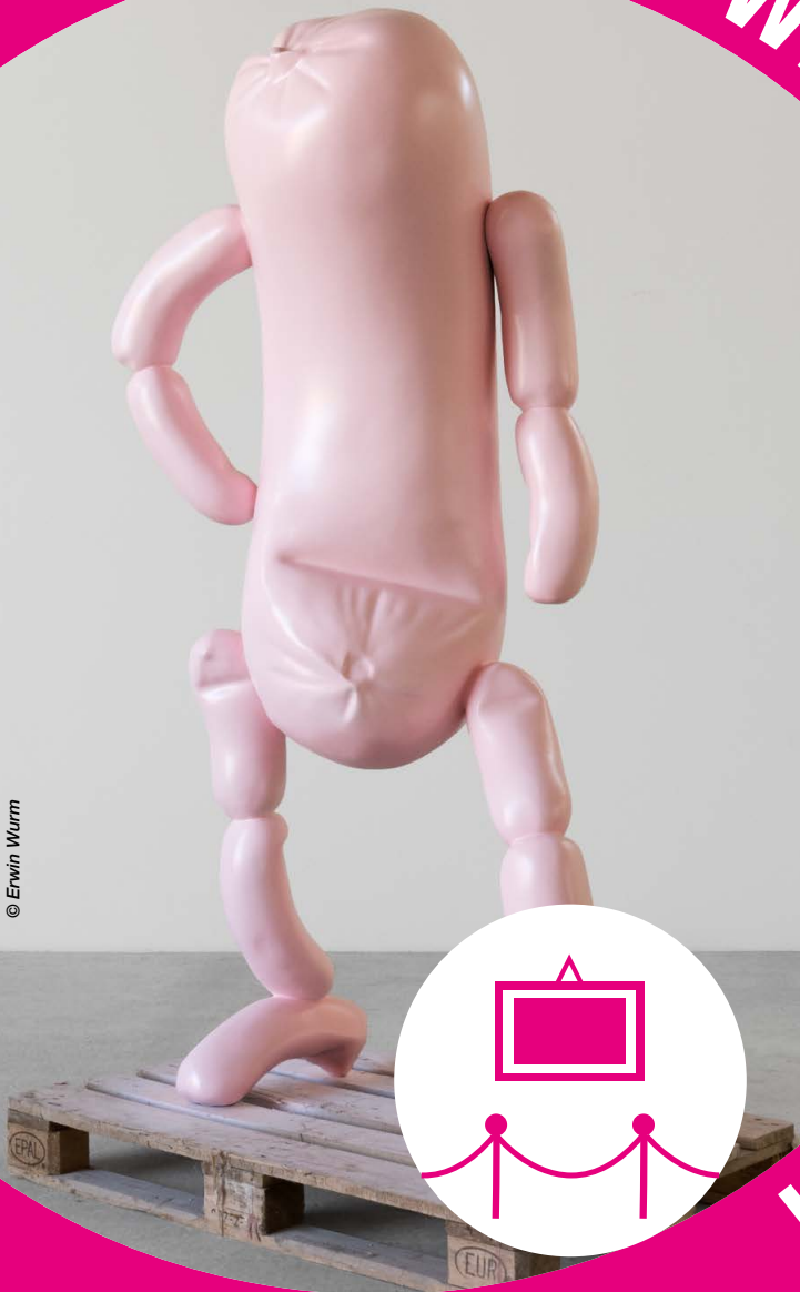
Erwin Wurm, Untitled (abstract sculptures) , 2018, brons en verf © Erwin Wurm