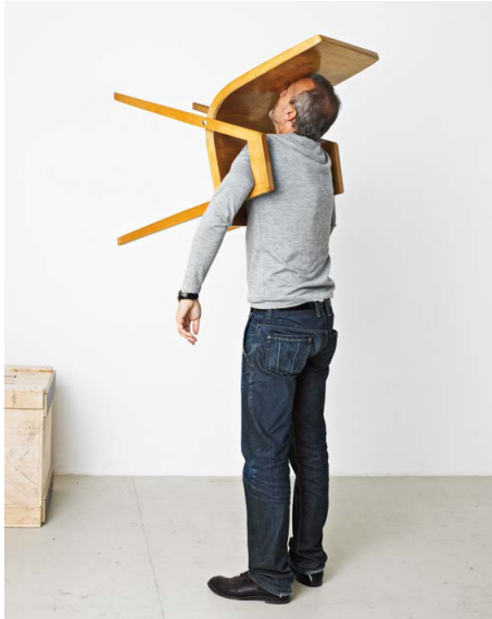
Erwin Wurm, The Idiot II, 2003, gemengde media, uitgevoerd door de kunstenaar © Erwin Wurm, Pictoright Amsterdam 2022