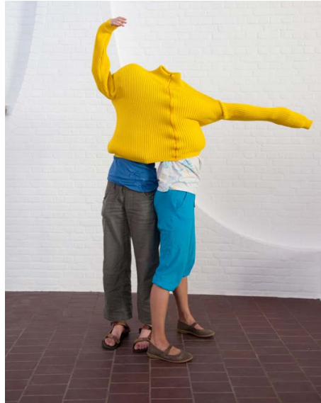
Erwin Wurm, Untitled (Double), gemengde media, 2002, uitgevoerd door publiek, foto Ottomura © Erwin Wurm