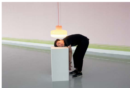
Erwin Wurm, Roast yourself under the sun of Epicurus, 2007, gemengde media, uitgevoerd door publiek © Erwin Wurm