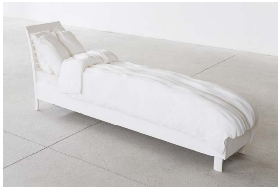
Erwin Wurm, Attic-Brain-Rain , 2014, epoxy, foto Eva Würdinger © Erwin Wurm