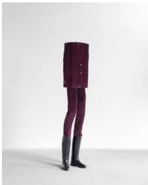
Erwin Wurm, Untitled (Kästemannner) , 2019 hout, metaal en textiel © Erwin Wurm