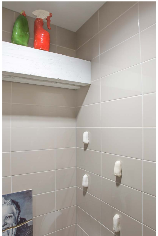
Foto's van de tentoonstelling 'Kunst op de wc' van kunstenaar Koos Buster op de toiletten van Museum Jan Cunen.