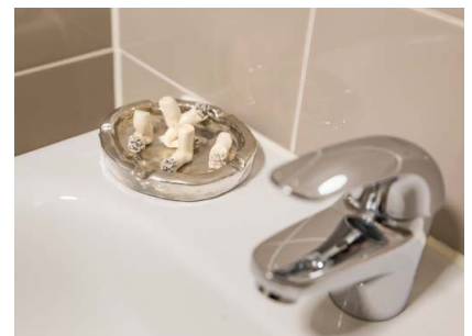
Foto's van de tentoonstelling 'Kunst op de wc' van kunstenaar Koos Buster op de toiletten van Museum Jan Cunen.