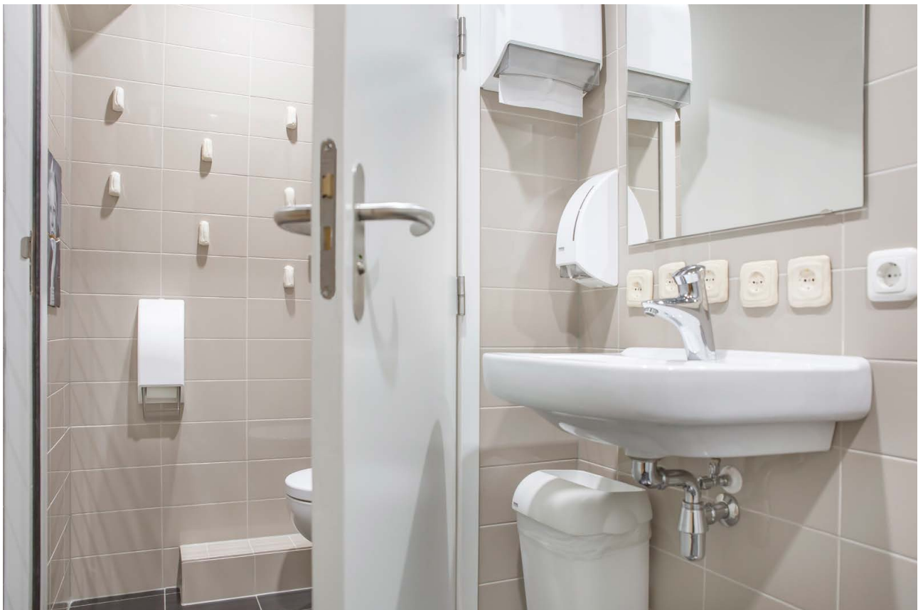
Foto's van de tentoonstelling 'Kunst op de wc' van kunstenaar Koos Buster op de toiletten van Museum Jan Cunene.